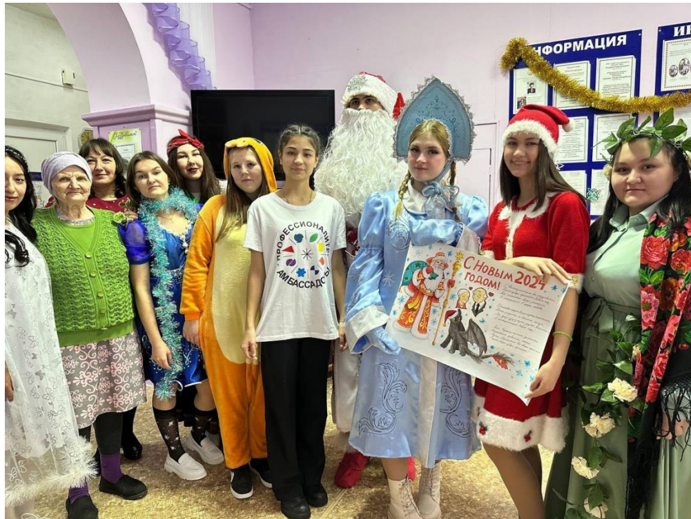
Волонтеры колледжа организуют досуг для получателей социальных услуг в доме престарелых