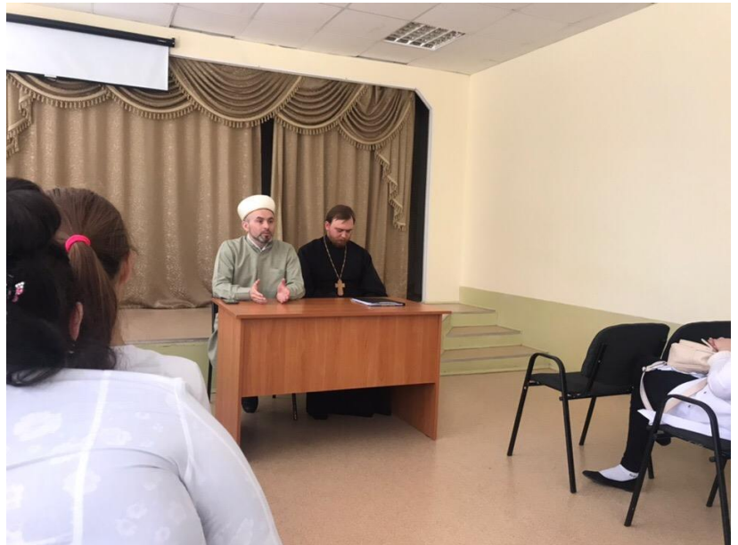
Встречи с представителями религиозных конфессий по проблемам профилактики наркозависимостей