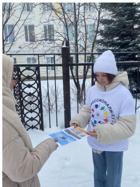
Участвуем в федеральном проекте «Профессионалитет» Являемся Амбассадорами Профессионалитета