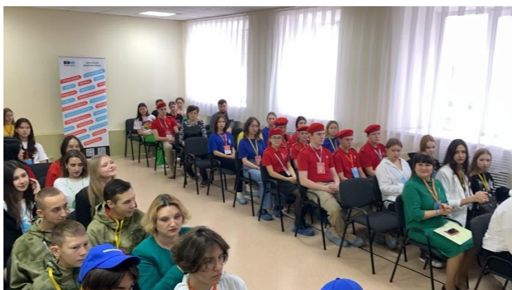
Организация и проведение на базе колледжа ПРО-форума участников республиканского этапа международного конкурса социальных проектов в области здоровьесбережения «Общее дело ПРО» среди команд республики Башкортостан