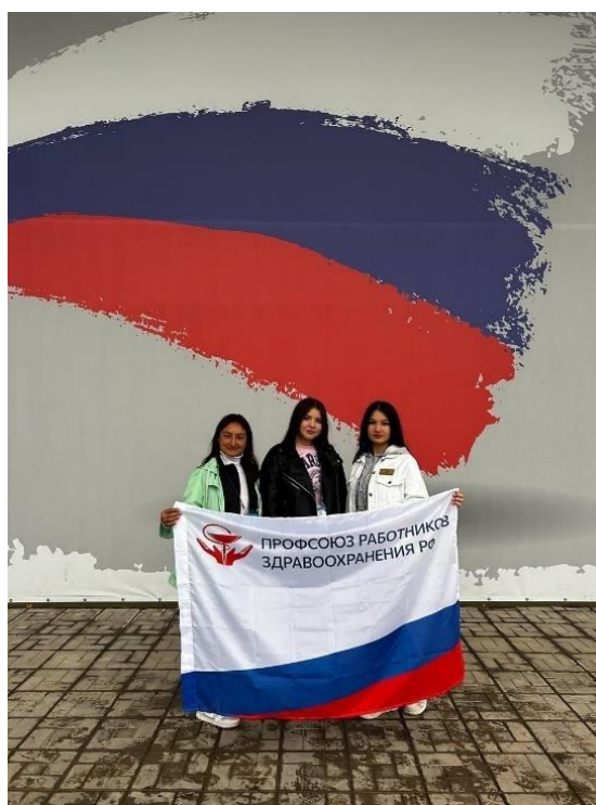
Участие студентов в образовательном форуме парке «Патриот»