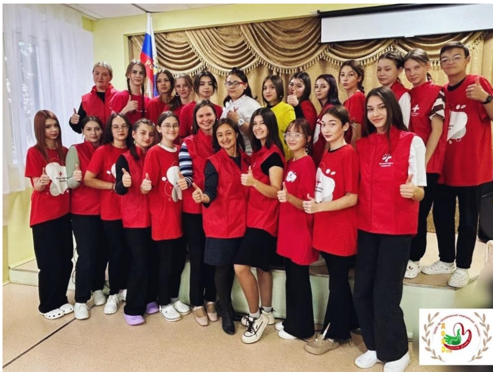
Новый состав волонтерского центра на 2023-2024 учебный год