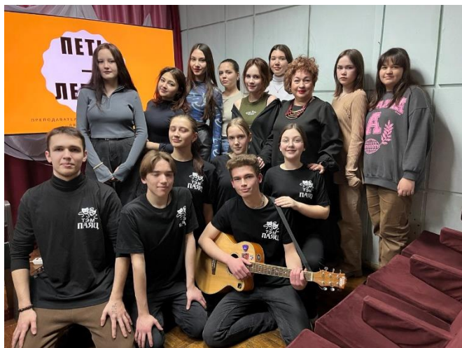
Мастер-классы по Пушкинской карте

https://vk.com/belmedkolrb_professionalitet?w=wall-217344471_155