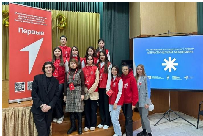
Участия студентов колледжа в образовательных муниципальных и республиканских форумах и грантовых конкурсах