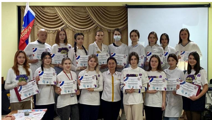
Еженедельная линейка с вручением наград студентам колледжа за участия в мероприятиях на разных уровнях