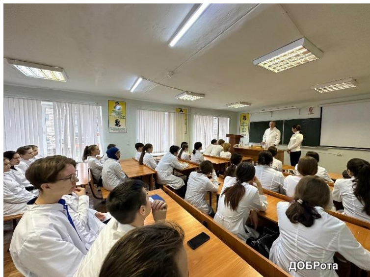
Проводим встречи «На равных» с будущими коллегами