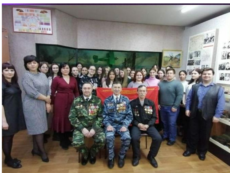
Встреча с ликвидаторами ЧС на Чернобыльской АЭС