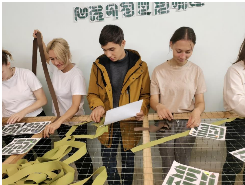
Плетем маскировочные сети