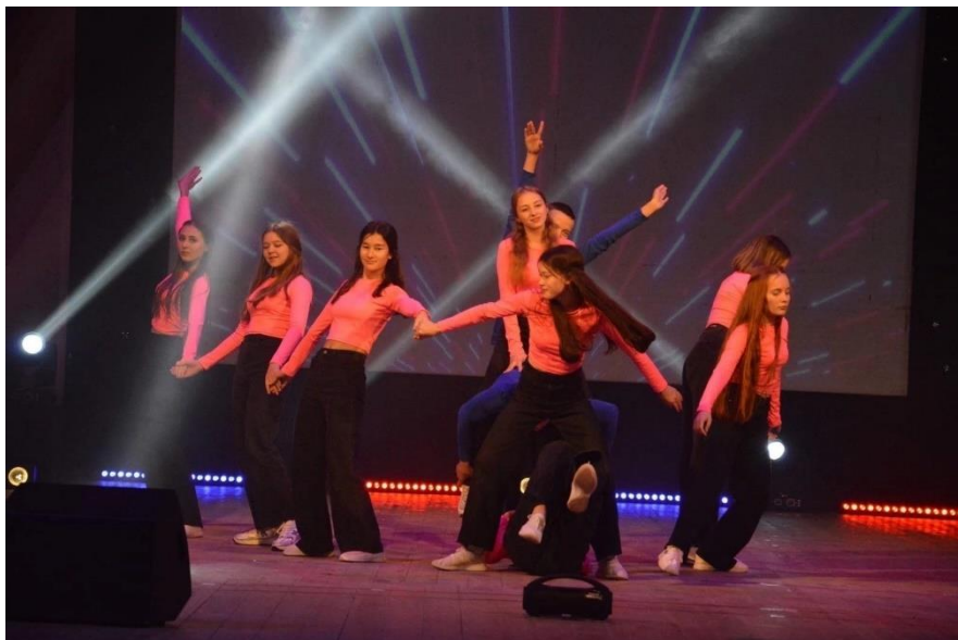
Участия творческого клуба «Полет» в республиканских и муниципальных мероприятиях