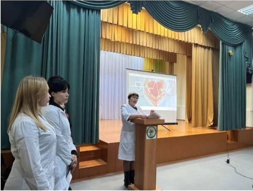
Встречи с врачами узких специальностей по проблемам профилактики наркозависимостей